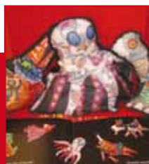
Ik voel een voet (groep 1/2)