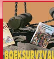
Boeksurvival (groep 8)