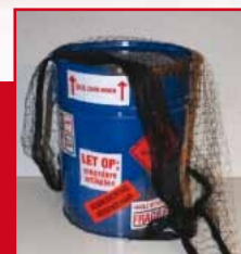
Juttersbuit (groep 4)