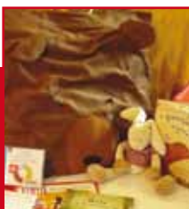
Bentje (groep 1/2)