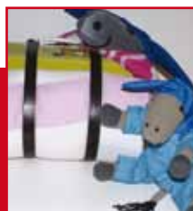
Kleine ezel (groep 1/2)