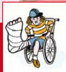
Reizen met je poot omhoog (groep 7)