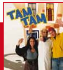
TAMTAM (groep 1/2)