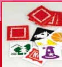
Bibliomemo (groep 5)