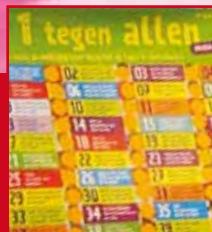
Een tegen allen (groep 7)